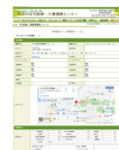
調査フォームイメージ画像

連携センターのホームページが完成し、運用を開始しています。市内の医療・介護事業所リストの他、当センターの活動内容や研修の報告などを掲載しています。また、今後は職種間で