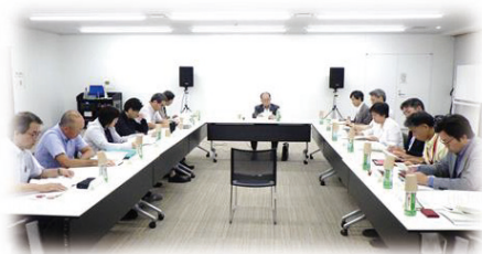
7月22日、令和元年度第1回秋田市在宅医療・介護連携推進協議会が開催されました