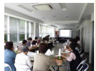
広面地区の町内会で

「往診している医療機関が知りたい」「在宅介護の具体例が知りたい」などの声をいただいています。今後は講座内容の充実を図るため、専門職の皆様にもご同行をお願いする予定です。その際はご協力のほどよろしくお願いいたします。