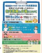
市民講演会チラシ

公共施設や医療機関などにチラシを設置しておりますので、地域の方々へ周知のご協力をよろしくお願いいたします。関係者の方の参加も大歓迎！