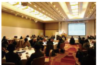
平成30年度セミナー

職能団体のけん引役となって一緒に秋田の在宅医療・介護の連携を盛り上げていきませんか？10月に新しい形の研修会を開催予定です。